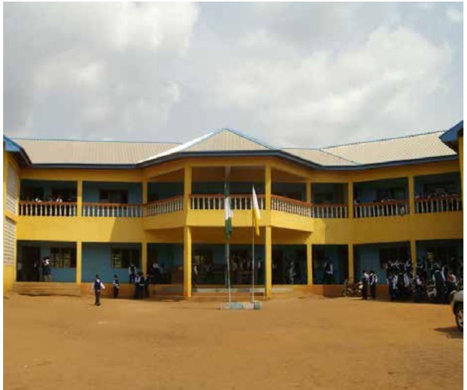
Bau einer Sekundarschule in Ahiara, Nigeria

Den Einstieg in die Entwicklungszusammenarbeit findet der ÖWK 1990 über persönliche Kontakte zu Vertretern der Diözese Umuahia, unweit des heutigen Standortes von MBARA OZIOMA im Südosten Nigerias. Im Hinterland dieser Diözese entstehen sechs Gesundheitsstationen. Es folgt ein Schulbau in der Nachbardiözese Ahiara. In Zusammenarbeit mit unseren Freunden in Nepal folgt der Bau von 17 Schulgebäude und über 2.300 Biogasanlagen. In Indien engagiert sich der Kreis seit über 15 Jahren für die Fürsorge von HIV-infizierten Waisenkindern. Die Zusammenarbeit mit diesen internationalen Partnern hat in diesen 30 Jahren unser Leben mit kostbaren Begegnungen und neuen Perspektiven auf die Welt bereichert.