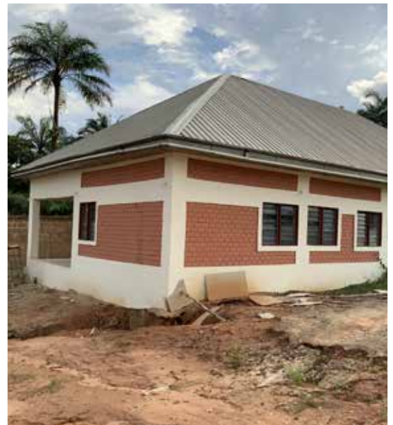
In diesem Jahr erstellt: das Wohnheim, eine Mehrzweckhalle und eine Küche

Zentrales Anliegen war für uns immer die Förderung der Jugend. Anfangs bildeten wir Theatergruppen, boten Musikprojekte sowie Sport- und Freizeitaktivitäten an, gründeten sogar eine Pfadfindersektion. All diese Projekte liessen einen neuen, grösseren Traum entstehen. Wir wollten für die Jugend von Umunumo eine nachhaltige Bildungsstätte schaffen.