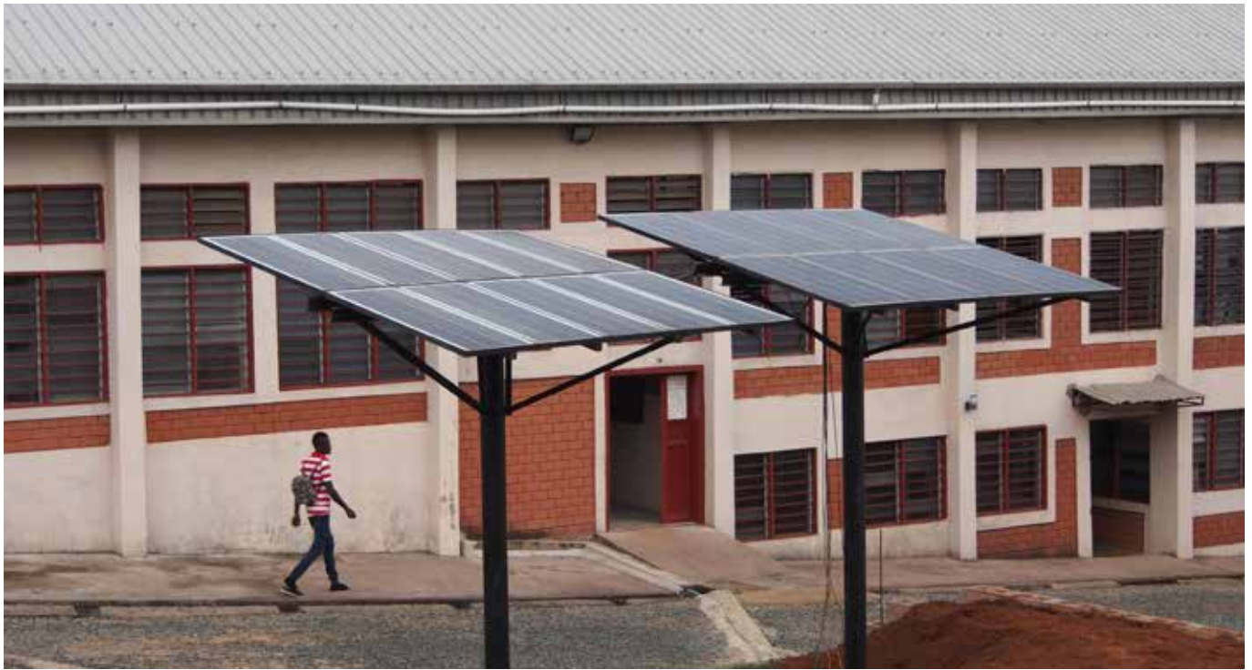
Dank Solarenergie ist die Schule unabhängig vom Treibstoffmarkt