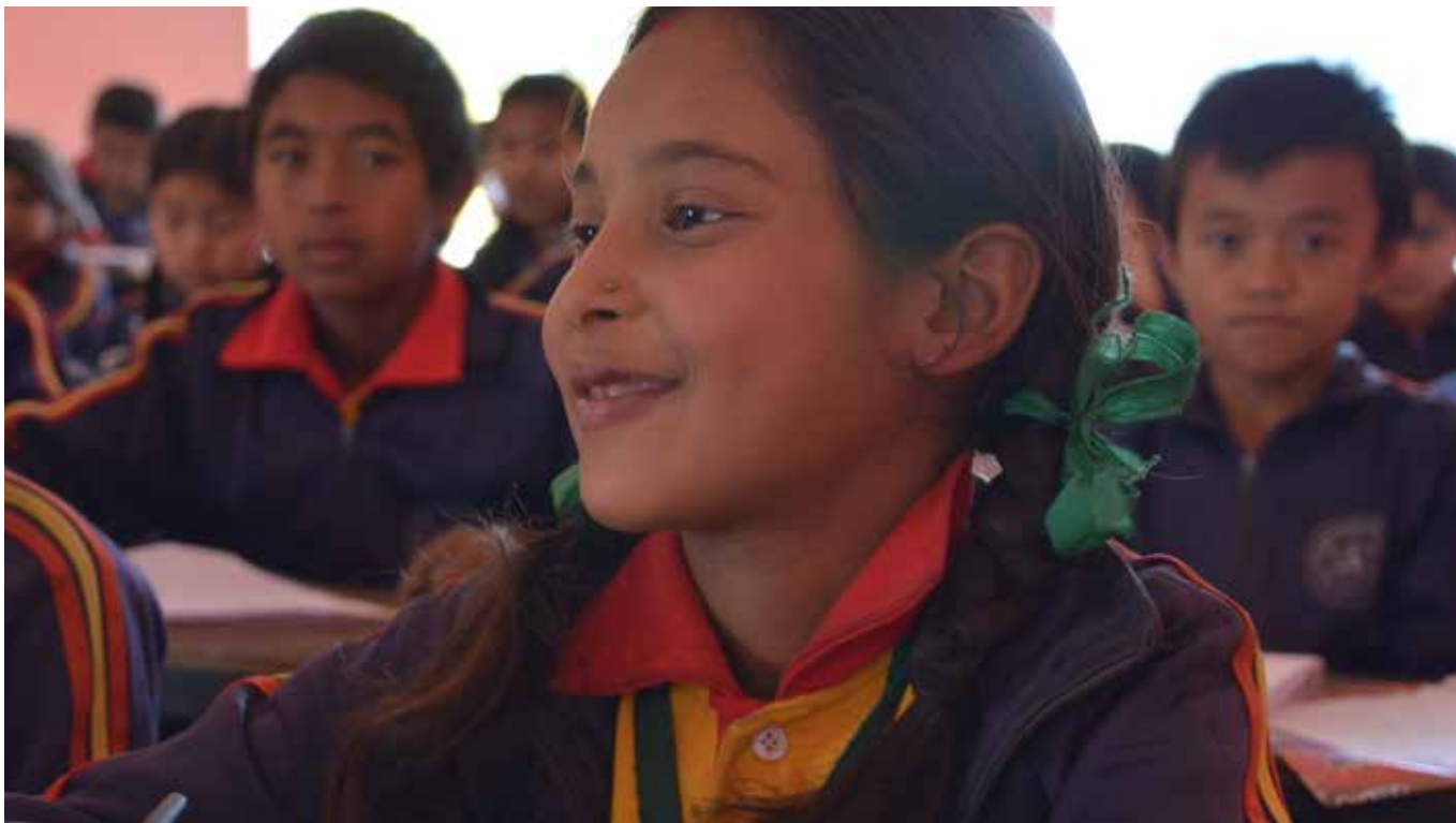
Eine Schülerin in Nepal