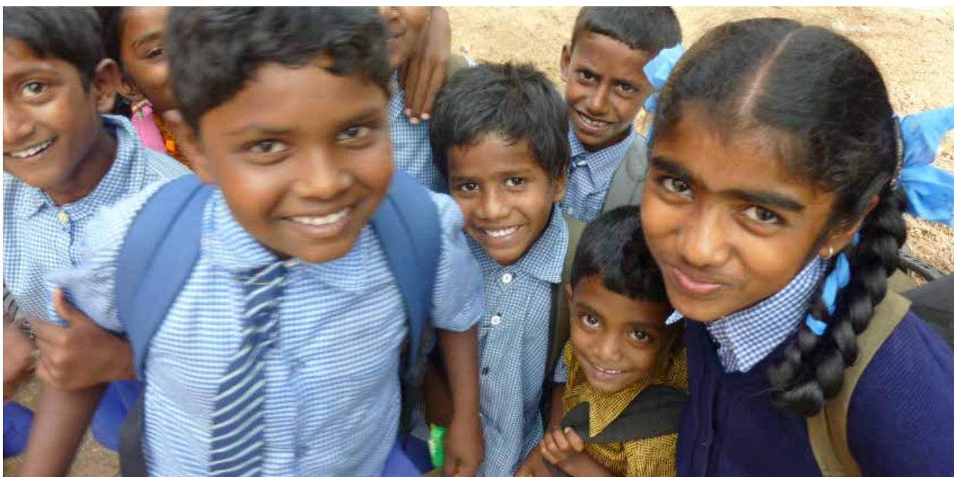
Unterstützung für HIV-Waisen in Indien

sammenarbeit. Dies ist keineswegs selbstverständlich. Unser Verein gründet auf ehrenamtlichem Engagement und hat nur beschränkte personelle Ressourcen. Heute sind wir jedoch dankbar für die Partnerschaft mit MBARA OZIOMA. Wir freuen uns über die beeindruckende Bilanz der letzten zehn Jahre sowie auf all die Begegnungen, die noch vor uns liegen.