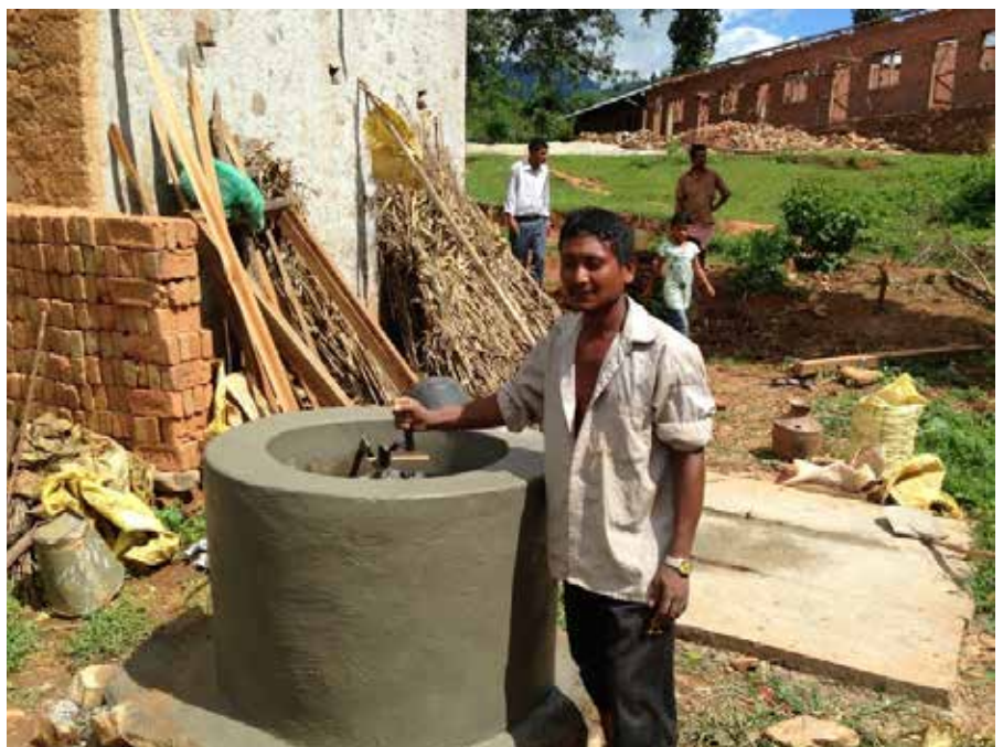
Eine Biogasanlage ist fertiggestellt, im Hintergrund entsteht eine neue Schule